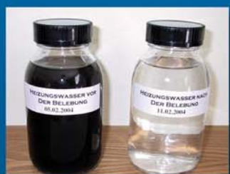
Hopital Rottalmünster en Bavière Eau de chauffage chaudière N° 1

Afin d'éviter tout dysfonctionnement du système, il sera nécessaire de nettoyer et nettoyer régulièrement ce filtre et le porte-filtre.